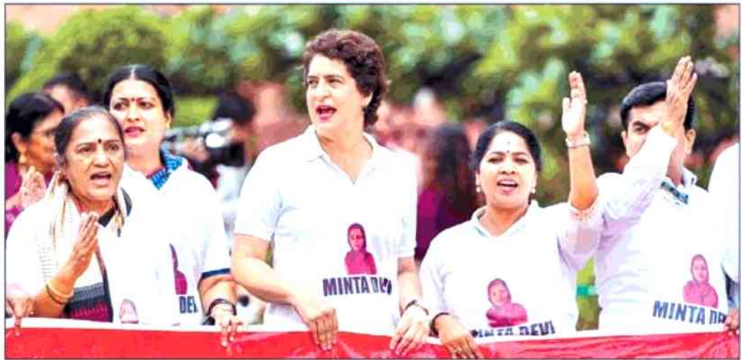
नई दिल्ली : विरोध प्रदर्शन करतीं प्रियंका गांधी वाड़ा और विपक्ष की महिला सांसद।

खेल प्रशासन में सुधार से जुड़े दो विधेयक चर्चा करने एवं पारित करने के लिए राज्यसभा में पेश किए जाने के तुरंत बाद विपक्षी दलों के सदस्यों ने बिहार में मतदाता सूची के विशेष गहन पुनरीक्षण (एसआईआर) के मुद्दे पर हंगामा किया और सदन से बहिर्गमन कर गए। दो बार के स्थगन के बाद अपराह्न तीन बजे सदन की बैठक शुरू होने पर खेल मंत्री मनसुख मांडविया ने राष्ट्रीय खेल शासन विधेयक और राष्ट्रीय डोपिंग रोधी (संशोधन) विधेयक विचार करने एवं पारित करने के लिए पेश किए।