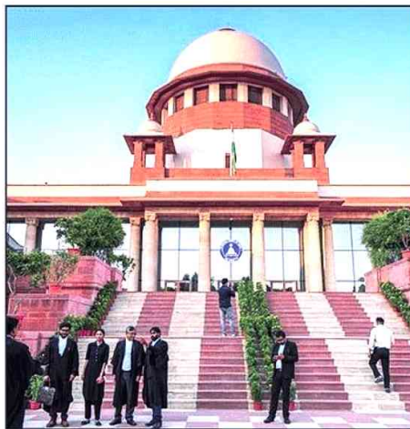
Those who aren't Indian citizens must be excluded from the electoral rolls, said SC

was an Indian and who was not while preparing the voters' list.